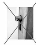
NEM záródási pont!